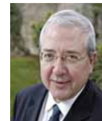
Mpho Franklin Parks Tau Alcalde ejecutivo Ciudad de Johannesburgo

En este contexto, se interpela a las grandes ciudades para que muestren una mayor capacidad de respuesta para atenuar y afrontar los retos de la urbanización. Las ciudades, como tales, tienen la misión de ser más humanas con el fin de ofrecer una mejor calidad de vida, facilitar el acceso a las oportunidades y crear la coyuntura que permita mitigar la situación acuciante que amenaza a los más vulnerables, manteniendo al mismo tiempo unos altos niveles de productividad y prestación de servicios. Cabe remarcar que la habilidad de ser más humanas consiste en la capacidad de actuar y asumir responsabilidades. Acción y responsabilidad son interdependientes. Ser más humanas significa extender la mano, pero también significa que los ciudadanos y las ciudades están unidos y mutuamente vinculados por la responsabilidad, el compromiso, la capacidad resolutive y la acción.